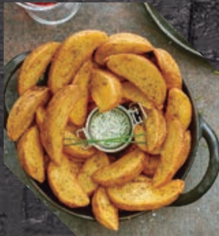
903435 PATATA GAJO SKIN ON 5 BL / 2,5 KG