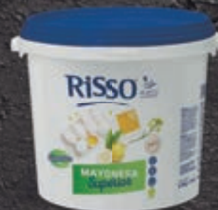
MAYONESA SUPERIOR* 702501 - 5 L