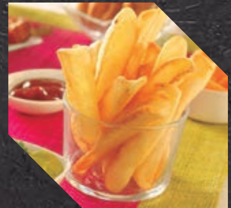
903415 PATATA FRYN' DIP S/P 5 BL / 2,5 KG