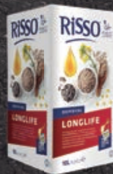
ACEITE LONG LIFE* 702402 - 10 L