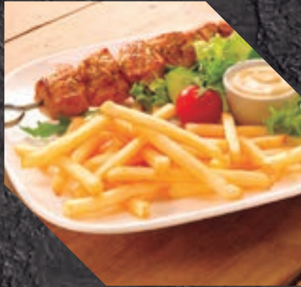
903413 PATATA JULIENNE 5 BL / 2,5 KG