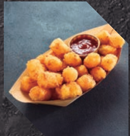
903417 PATATA POPS 5 BL / 2,5 KG