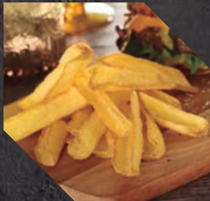
903406 PATATA FRYN' DIP C/P 5 BL / 2,5 KG