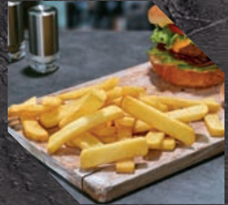
903412 PATATA STEAK HOUSE 5 BL / 2,5 KG