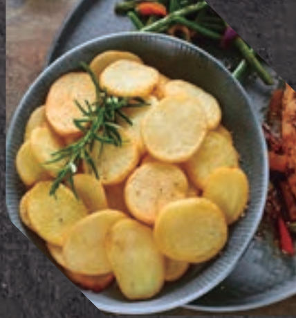
903407 PATATA DOLLAR 4 BL / 2,5 KG