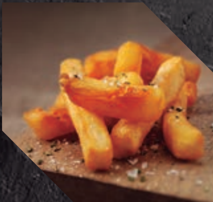
903421 PATATA BISTRO STYLE 5 BL / 2,5 KG