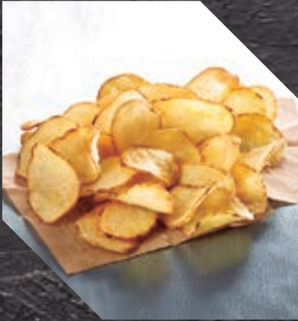
903418 PATATA CRUNCHY PETALS 4 BL / 2,5 KG