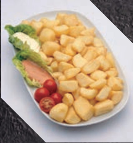
903409 PATATA BRAVA 5 BL / 2,5 KG