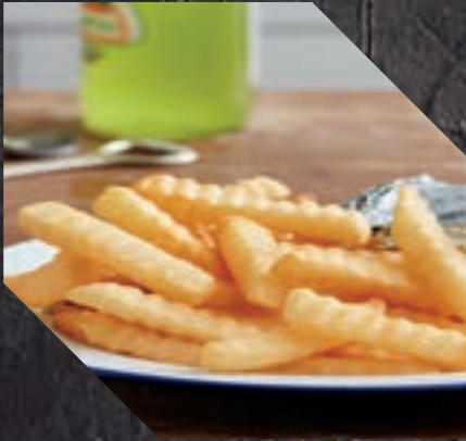
903404 PATATA CRINKLE 5 BL / 2,5 KG