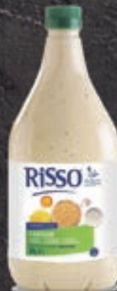
SALSA CESAR 702005 - 6 / 2 l