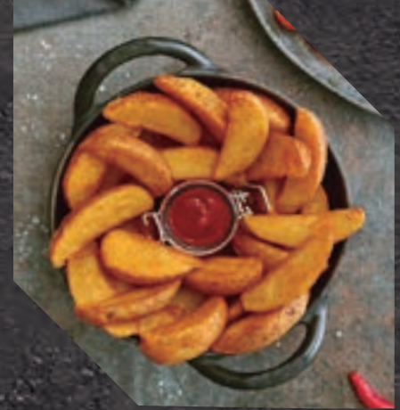
903411 PATATA GAJO SPICY 5 BL / 2,5 KG