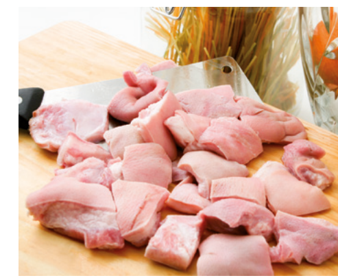
905022 · 6 bl / 1 Kg Caretas de Cerdo