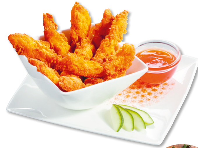
903202 · 1 cj x 2 Kg 96 ud/cj Bandidos