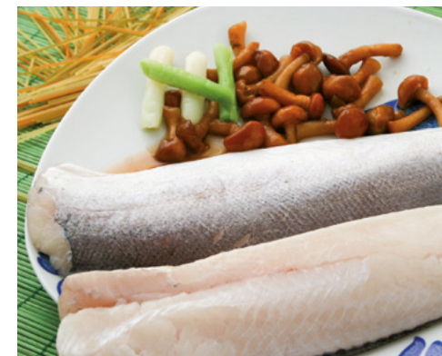
902061 · 1 cj / 5 Kg Filete de Merluza 8/10