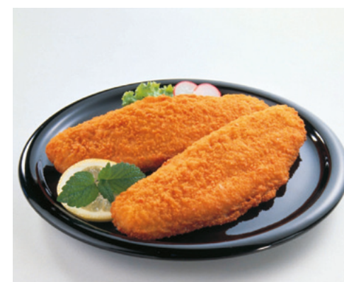
903001 · 8 bl / 5 ud Filete Merluza empanado