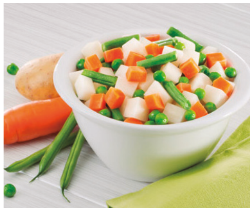
904014 Ensaladilla 904028 15 st / 400 g 4 bl / 2,5 Kg