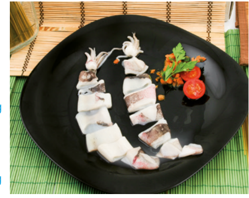
902095 · 6 bl x 1 Kg Calamar Troceado