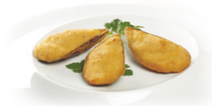
903006 · 1 cj x 3 Kg Mejillón Tigre Relleno