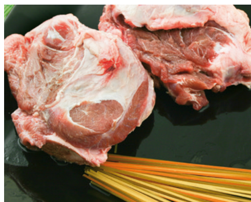
905089 · 7 Kg Carrillada de Cerdo C/hueso