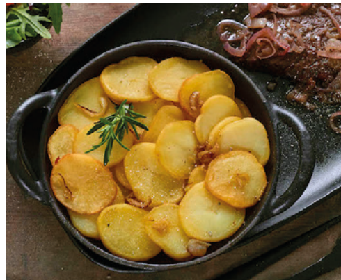
903407 · 4 bl / 2,5 Kg Patata Dollar