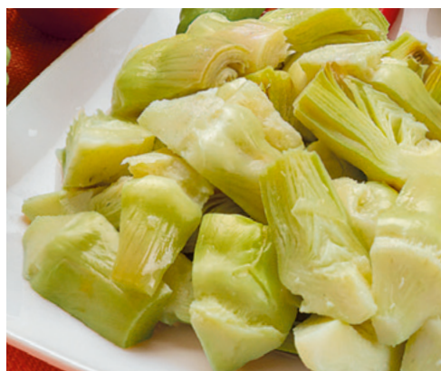
904005 · 4 bl / 2,5 Kg Alcahofa troceada