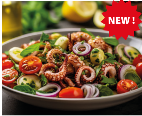
982009 · 10 st x 500 g Pulpo Topping