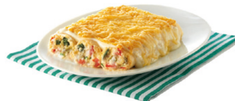
903067 · 12 st / 300 g Canelón V. Asada y Philadelphia