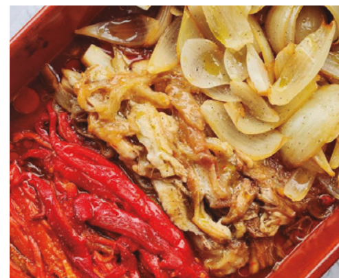
998011 · 8 bl / 1 kg Verduras asadas