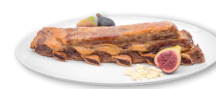
905136 · PV Tira costilla Vacuno