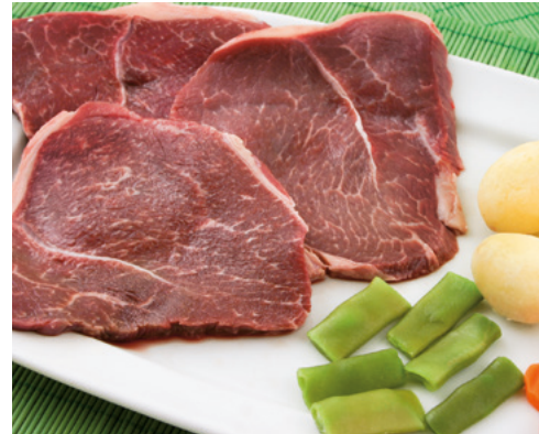
905036 · 5 Kg Filete de Ternera 0,7 cm