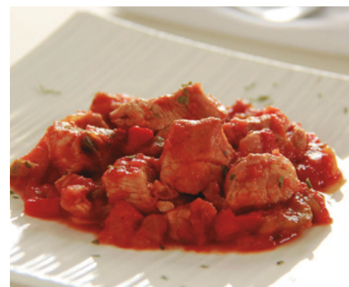
970104 · 1 bd / 1.200 g Magro con tomate