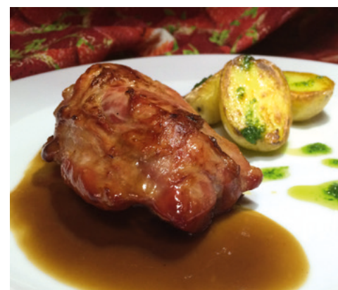
905133 · 6 st / 6 ud Codillo cerdo jugo s/h