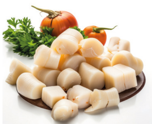
902088 · 1 cj / 5 Kg Trozos de Pota