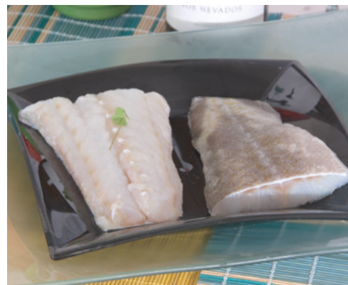
902070 · 1 cj / 5 Kg Bacalao Filete Menú