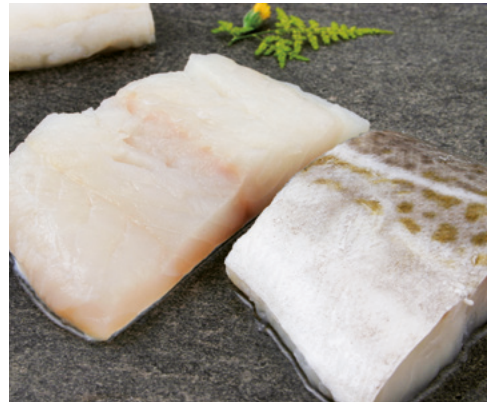
902089 · 1 cj / 4 Kg Supremas Bacalao