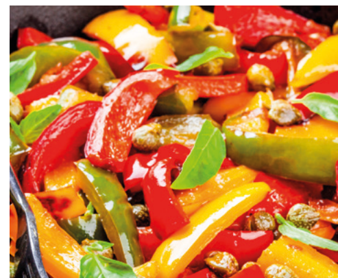
998010 · 8 / 1 Kg Pimiento asado tiras