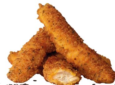
903513 · 5/1 kg (25/40 ud x kg) Chik'n Fingers Tikka