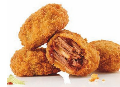
903515 · 3/1 kg (36/45 ud x kg) Pulled Pork Bites

*El gramaje o formato de las piezas es el de menor peso