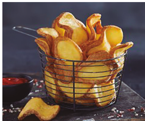
903418 · 4 bl / 2,5 Kg Pata Crunchy Petals