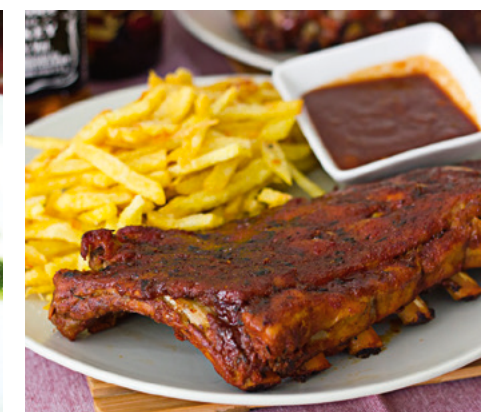
905140 · PV Costilla Barbacoa