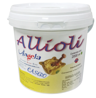
703020 · 1 cubo 2 l Alioli Valenciano