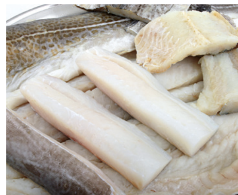
901040 · 1 cj / 6 Kg Lomo Bacalao Selecto +300