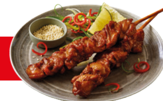
903207 · 4 bl / 2,5 Kg Dados Pollo Asados