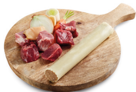
903023 · 3 bl / 10 ud Canelon Carne Asada