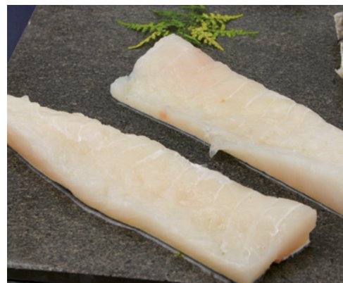
902057 · 4 Kg Porciones Bacalao Menú