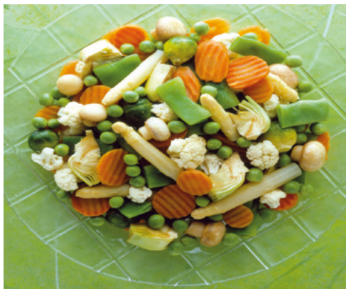
904006 Menestra Verduras 904013 15 st / 400 g 4 bl / 2,5 Kg