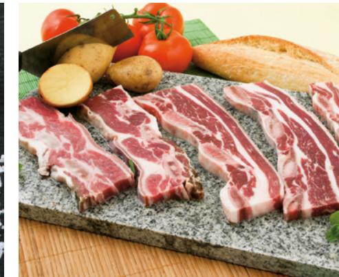
905074 · 5 Kg Churrasco de Ternera