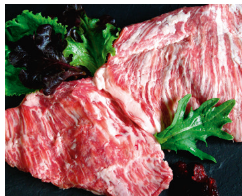
905075 · PV Secreto de Cerdo