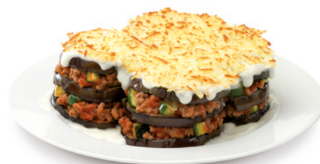
903031 · 12 st / 300 g Mussaka verduras