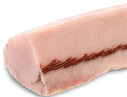
900603 · PV Lomos de Emperador