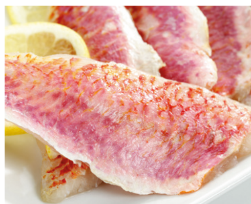
902002 · 1 cj / 5 Kg Filete de Rubio 40 / 80 g