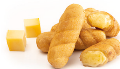
903253 · 2 bl / 40 ud Tequeño Queso Gouda