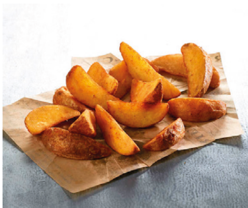
903411 · 5 bl / 2,5 Kg Patata gajo Spicy