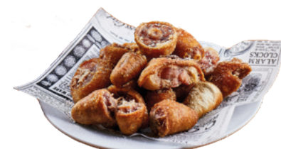
905088 · 6 bl / 1Kg Rabo de cerdo cocido