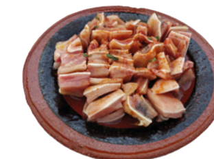
905144 · 12 st / 500 g Oreja cocida adobada