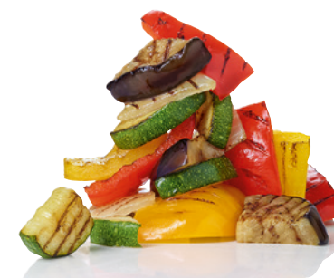
903531 · 5 bl / 1 kg Grillemüse Mediterranean