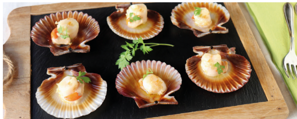
906009 · 16 st / 6 ud Veiras Pacífico M/C