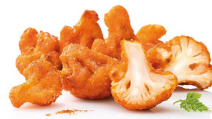
903510 · 6/1 kg (25/40 ud x kg) Cauli Wings