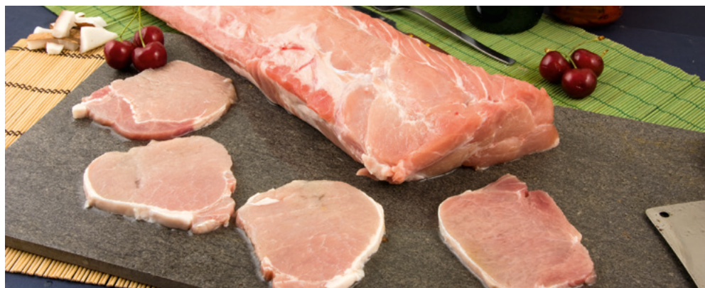
905025 · 4 Kg Lomo Fileteado