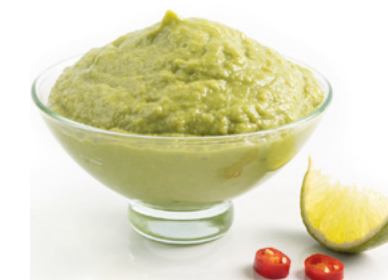
903255 · 8 bl / 500 g Guacamole