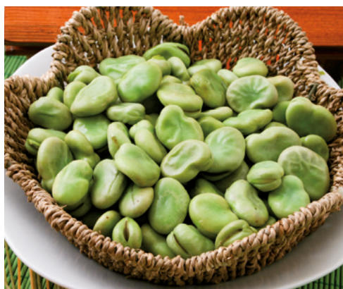
904020 · 10 bl / 1 Kg Habas gordas