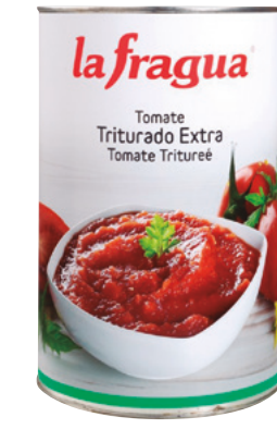
992001 · 3 b / 5 Kg Tomate Triturado Natural