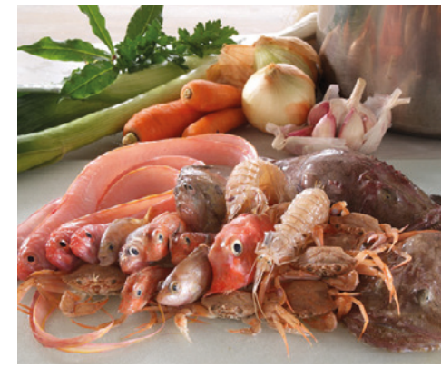
902048 · 1 cj x 3,5 Kg Morralla