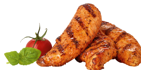
903514 · 5/1 kg (22/32 ud x kg) Fire Roasted Chik'n Fingers