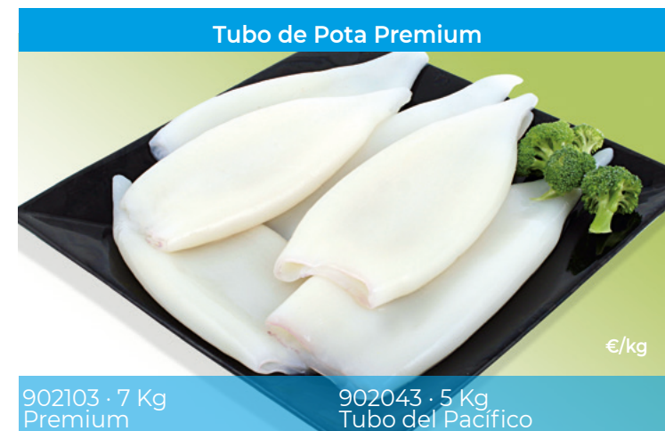
902103 · 7 Kg Premium