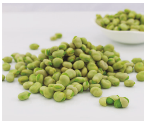
903322 · 6 bl / 1 Kg Habitas súper baby