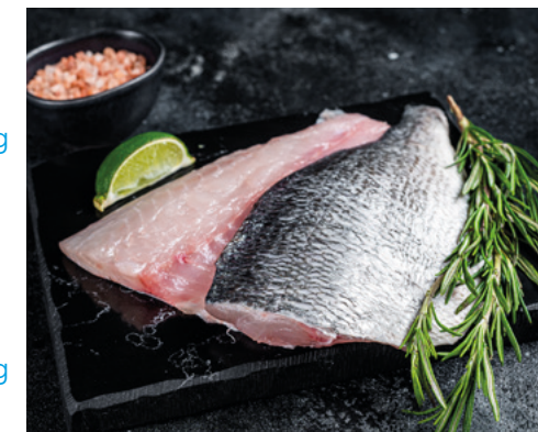
902064 · 6 cj x 5 Kg Filete Dorada 120/160