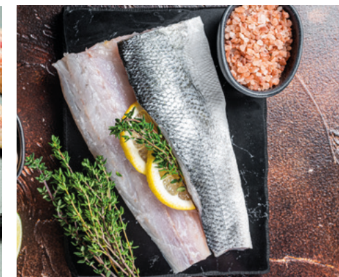
902056 · 1 cj x 5 Kg Filete Lubina 120/160