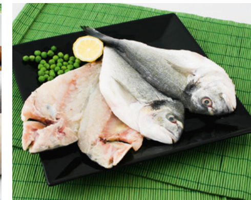
902017 · 1 cj / 5 Kg Dorada Mariposa