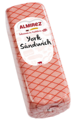
905930 · 2 br / 4 Kg Fiambre York