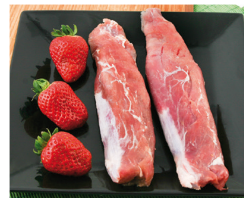
905012 · PV Solomillo de Cerdo