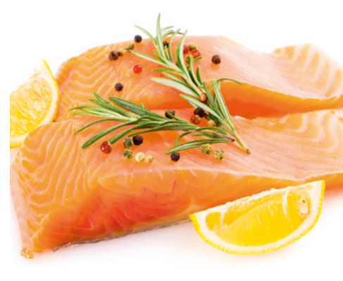
902153 · 12 ud (2 x 125) Lomo Salmón s/piel