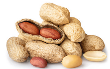
993010 · 3 kg Cacahuete