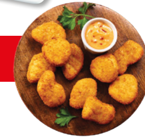
903203 · 1 cj x 2,5 Kg 314 ud/cj Pops sal y pimienta