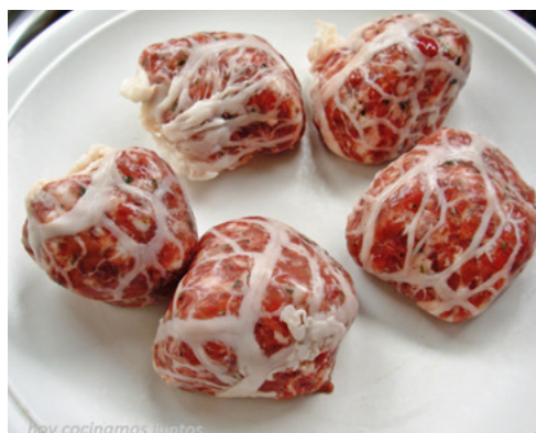
905092 · 3 Kg Figtells congelados