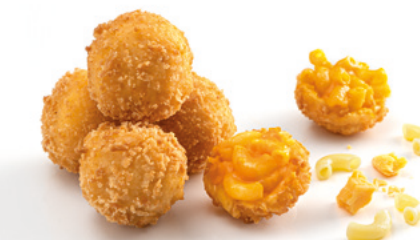
903254 · 4 bl / 1 kg Mc & Cheese