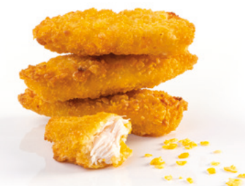
903252 · 5 bl / 1 kg Fingers Pollo Corn Flakes