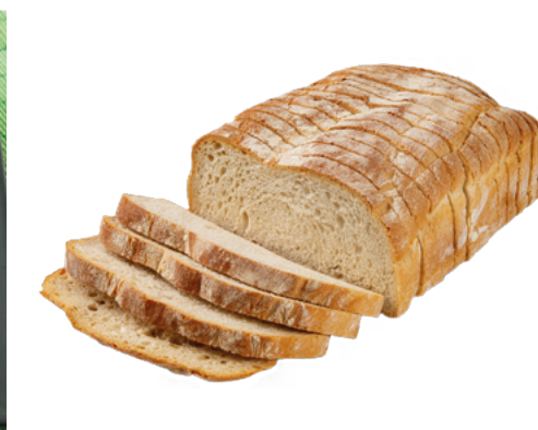
690307 · 5 ud / 1500 g Pan cuadrado