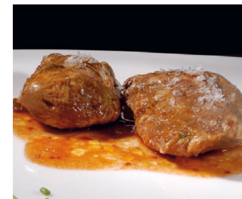
905068 · 8 st / 10 ud Carrillada de cerdo