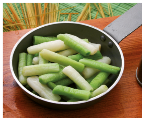
904001 · 5 bl / 1 Kg Ajos Tiernos Troceados