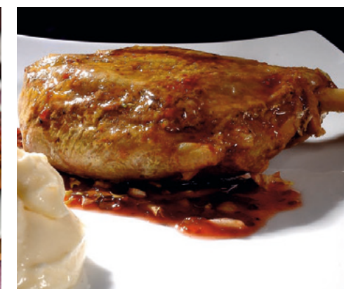
905141 · 6 st / 5 ud Codillo Jamón asado