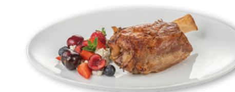
905123 · 8 st / 375 g Codillo Cerdo confitado