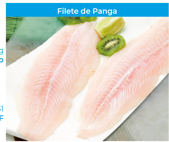
Filete de Panga