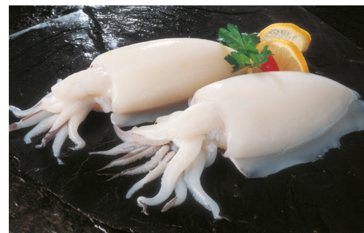
900001 · 1 cj / 7 Kg Sepión Extra