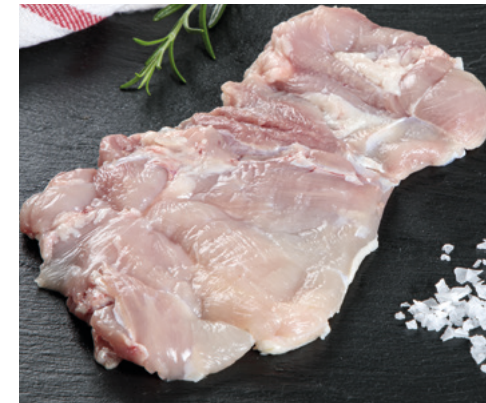
905006 · 5 Kg Muslo de Pollo deshuesado