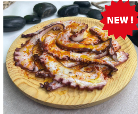
982011 · 12 st x 250 g Pulpo loncheado