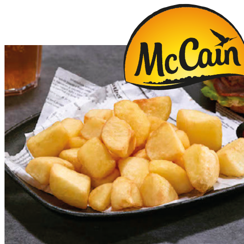
903409 · 5 bl / 2,5 Kg Patata Brava