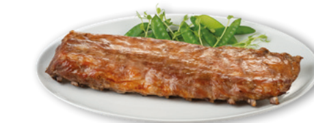
905135 · PV Costilla Ribs entera confitada