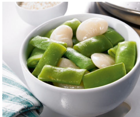
904045 Verdura paella 904046 15 st / 400 g 4 bl / 2,5 Kg