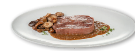
905131 · PV Meloso Añojo confitado