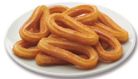
903003 · 8 bl x 500 g Churro Lazo Mamá c/leche