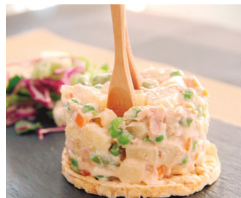
970105 · 1 bd / 1.300 g Ensaladilla Rusa