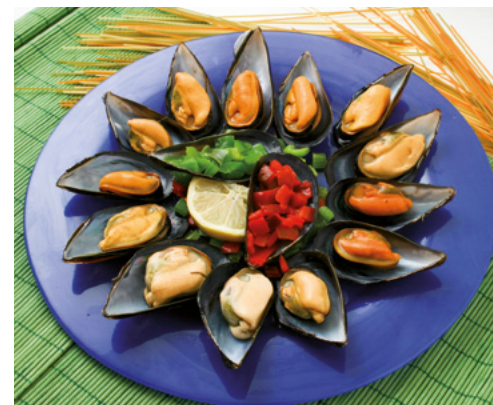
907024 · 1 cubo 3,5 Kg Mejillón media concha