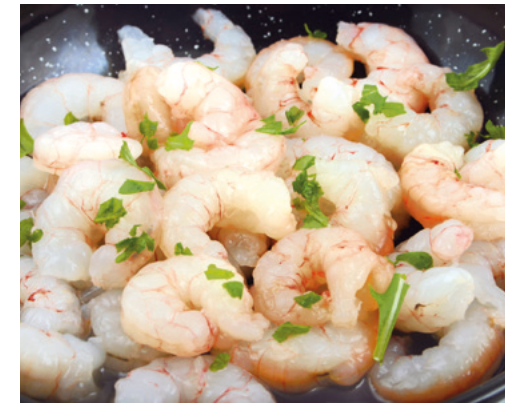
901990 · 12 st x 500 g Gamba Pelada s/agua gigante