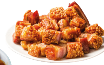
905063 · 6 st / 1 Kg Tajaditas de tocino