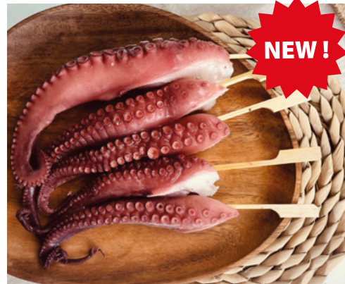
982010 · 2 bd x 1,5 Kg Pincho Pulpo 20 ud aprox