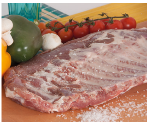
905050 · PV Costilla de Cerdo entera