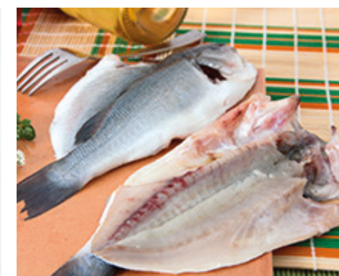
902018 · 1 cj / 5 Kg Lubina Mariposa