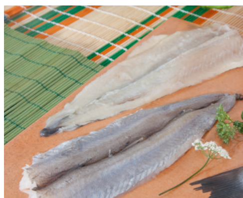
901005 · 1 cj / 7 Kg Filete de Bacaladilla