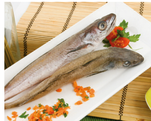
902136 · 1 cj / 5 Kg Pescadilla c/cabeza