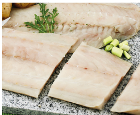
902024 · 1 cj / 5 Kg Porciones Fogonero