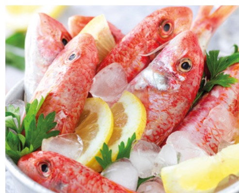
902026 · 1 cj / 5 Kg Salmonete entero