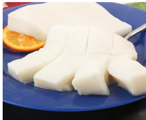
902111 · PV Manto de Calamar CH