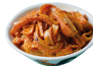
905149 · 6 st / 1 Kg Morro de cerdo cocido