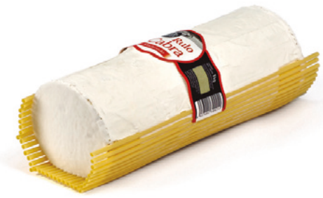
907113 · 2 st / 1 Kg Rulo mezcla madurado