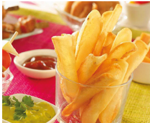
903406 · 5 bl / 2,5 Kg Patata Fry'n Dip