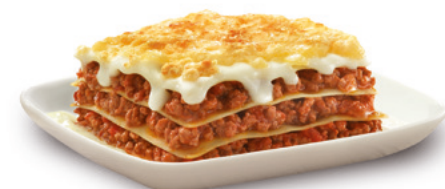
903030 · 15 bl / 300 g Lasaña Boloñesa c/ bechamel