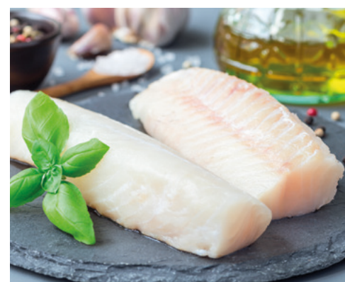
902073 · 1 cj / 5 Kg Porciones Merluza 90/110 g