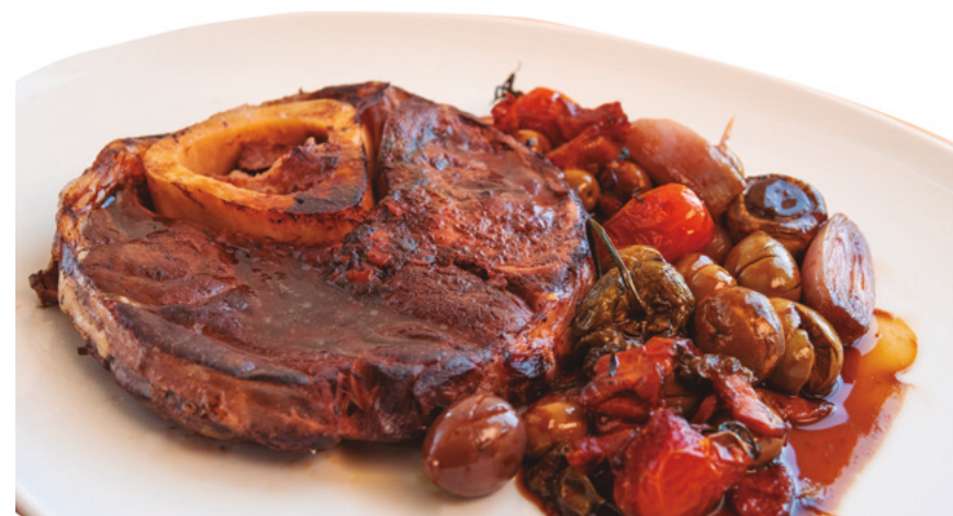
905132 · 15 st / 0,45 g Osobuco T. cocinado