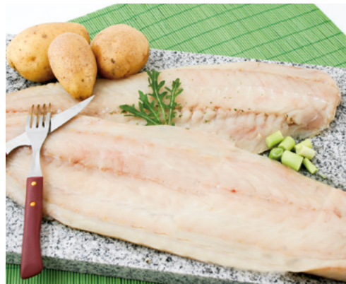
901008 · 1 cj / 11 Kg Filete Fogonero