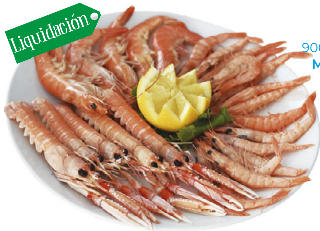
906091 · 5 st x 800 g Mariscada cocida