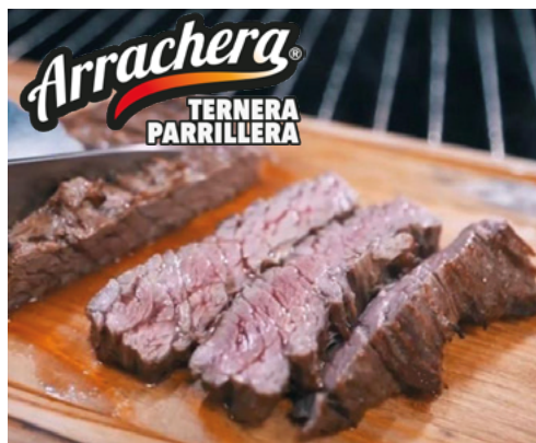
905067 · PV Carne de vacuno Arrachera