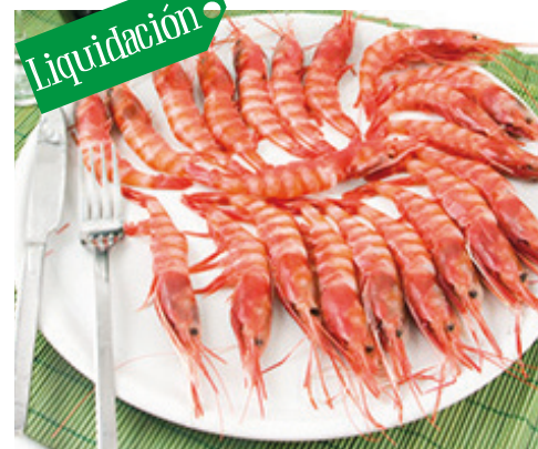
906003 · 1 Kg Camarón cocido alistado