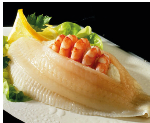
902003 · 1 cj / 5 Kg Filete de Solla Gambas