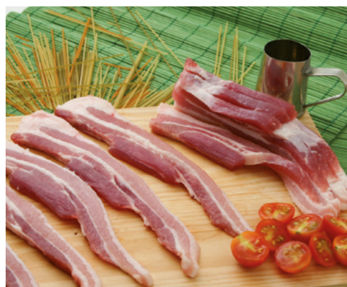
905056 · 4 Kg Panceta de Cerdo