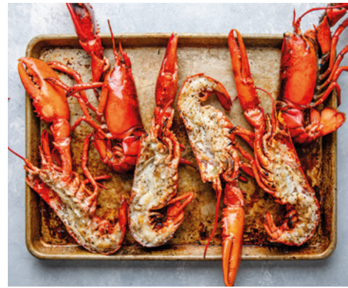
906010 · PV partido mitad Bogavante 450/500