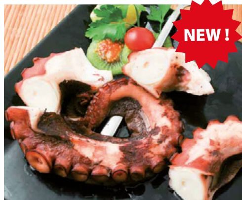
982015 · 4 Kg · 250/350 Pata Pulpo Cocido Jugo