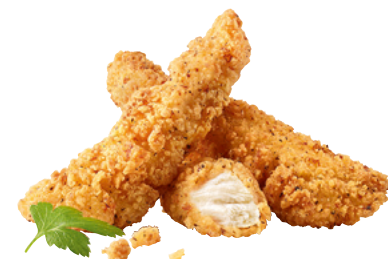
903512 · 5/1 kg (25/40 ud x kg) Homestyle Chik'n Fingers Buttermilk