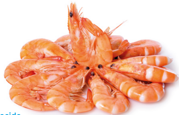
906090 · 1 Kg Langostino cocido