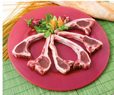
905076 · 2 Kg Chuletas de Cabrito