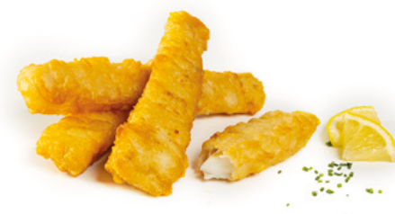
903251 · 1 cj / 3 Kg Finger Fish Tempura