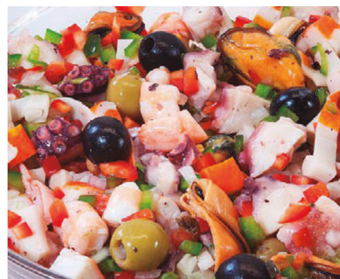
907006 · 4 Kg Salpicón cubo