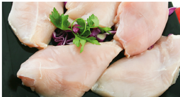
Pechuga Pollo entera