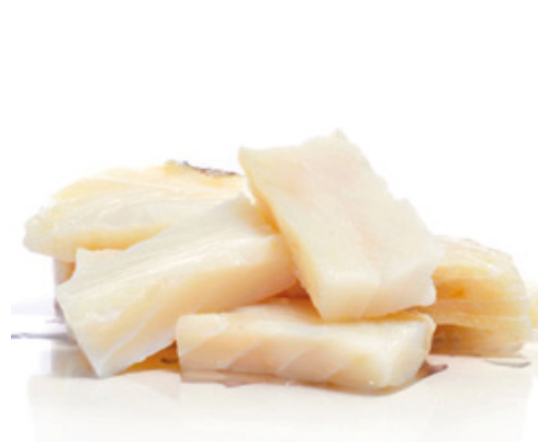
901003 · 1 cj / 5 Kg Bacalao Almuerzos