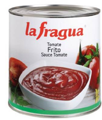
992003 · 6 b / 3 kg Tomate Frito