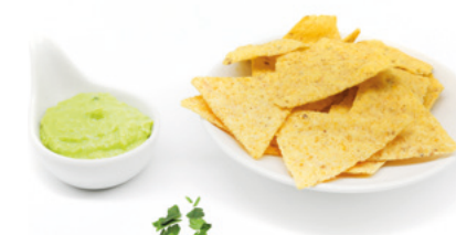
903256 · 12 st / 454 g Nachos