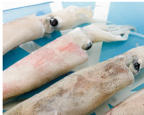
902029 · 5 bl / 1 Kg Calamar 4 Patagonico C/P