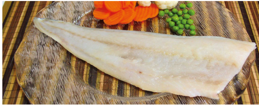
901002 · 1 cj / 11 Kg Filete Bacalao 1000+