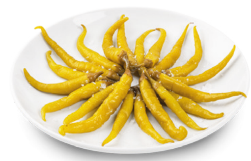
992028 · 1 lt / 1,6 kg Piparras