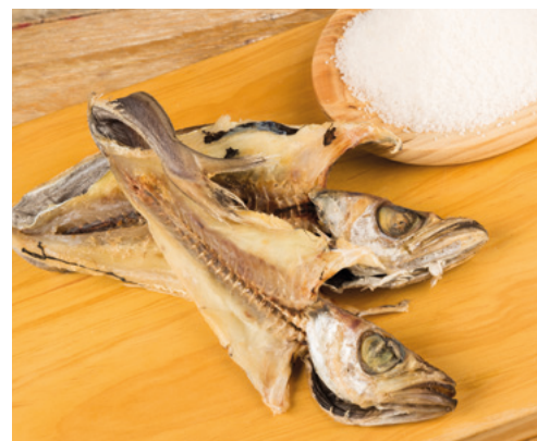
907201 · 2 kg Capellanes salados