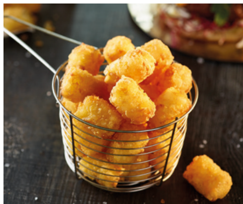
903417 · 5 bl / 2,5 Kg Patat Pops