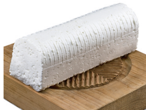
907102 · PV 1,5 kg aprox Queso Fresco