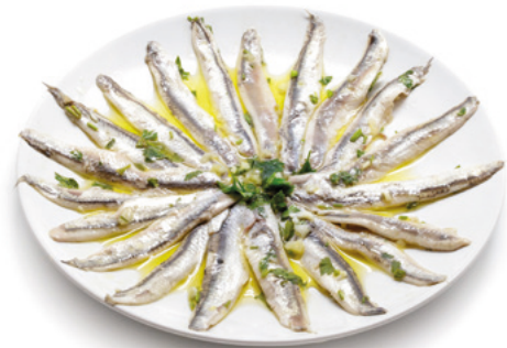
907001 · 700 g Boquerón al Ajillo