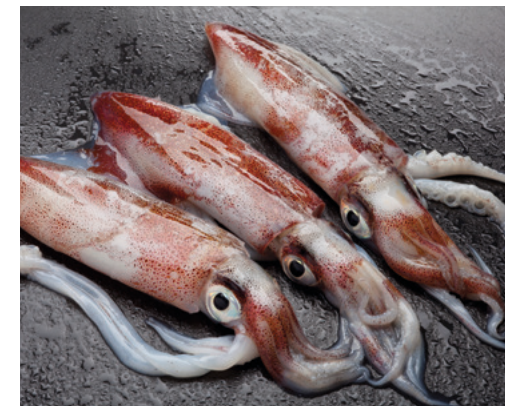
902104 · PV Calamar 3P Marruecos