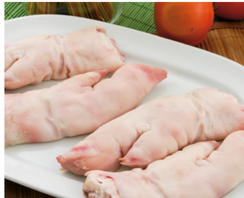
Pies cortados de cerdo limpios