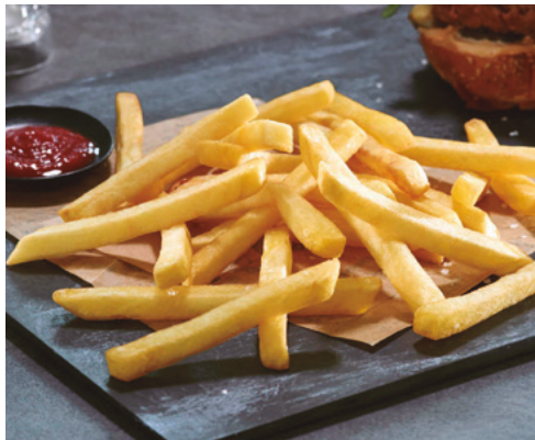
903402 · 5 bl / 2,5 Kg Patata 3/8 · 9/9