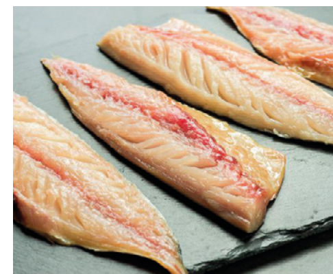
902019 · 1 cj x 3,5 Kg Filete de Caballa 80 /120