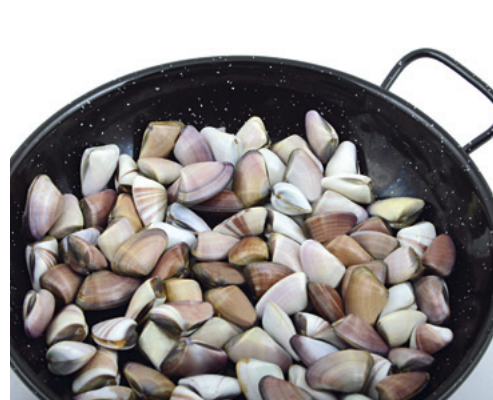
906045 · 12 st / 500 g Tellinas