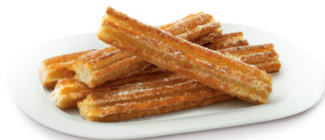
903004 · 8 bl x 320 g Porras prefritas rectas