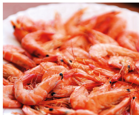
912021 · 10 st x 500 g Gamba cocida