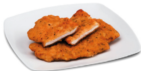
903012 · 3 bl / 1 Kg Escalope de pollo