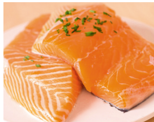
902059 · 1 cj / 5 Kg Salmón porciones