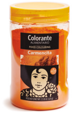
993007 · 1 cj / 6 ud Colorante Alimentario