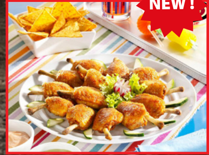
Tulipas Pollo Hot Spicy