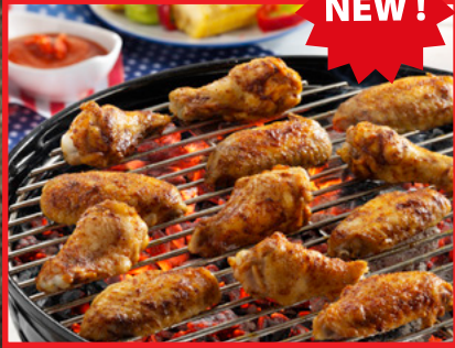
Alas Mississipi BBQ