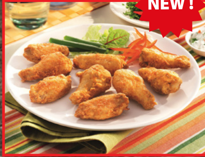
Alas Crispy Kentucky