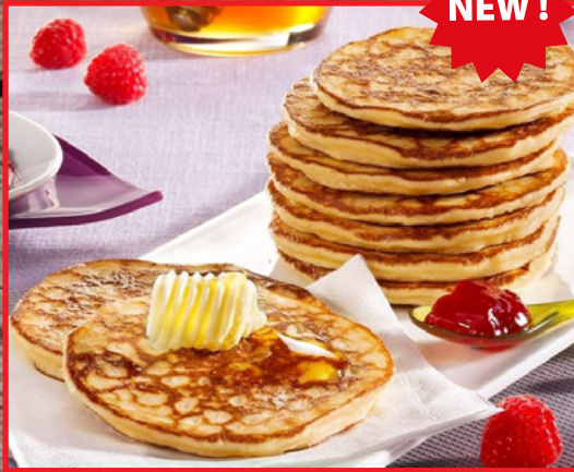
American Pancakes 45 gr