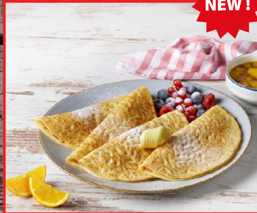
Plain Crepes 50 gr