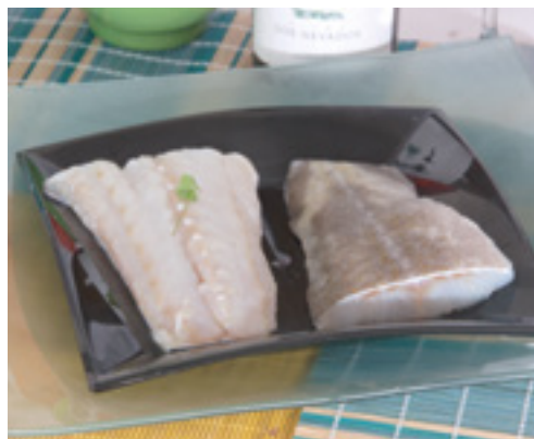
901003 · 5 kg Bacalao Almuerzos