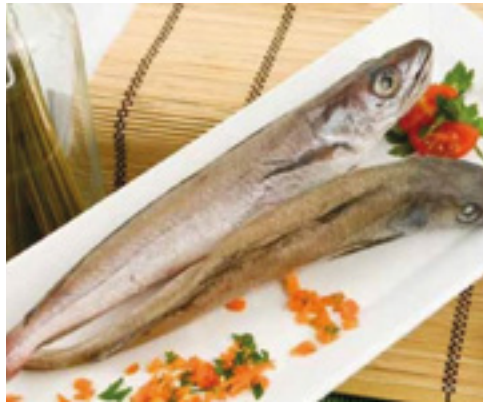
902136 · 6 Kg Pescadilla con Cabeza