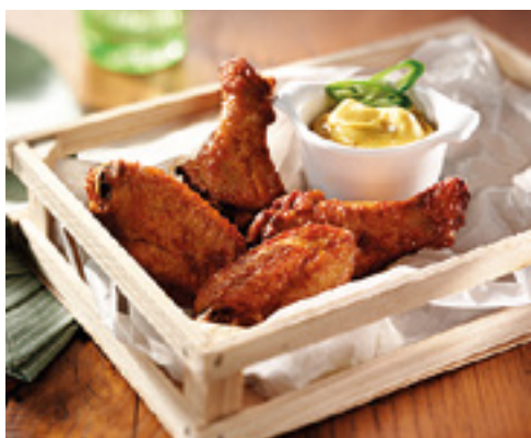
905106 · 2/2 Kg Alas de Pollo BBQ