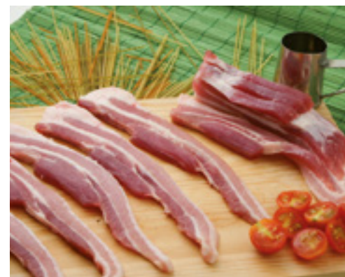
905056 · 5 Kg Panceta de Cerdo