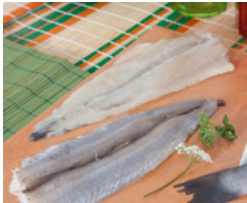
901005 · 7 Kg Filete Bacaladilla Mariposa