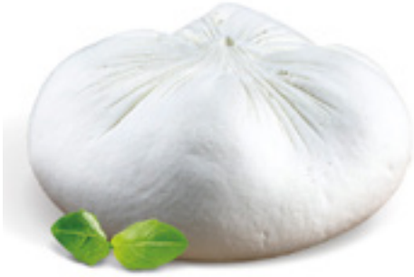
907101 · PV Queso Servilleta