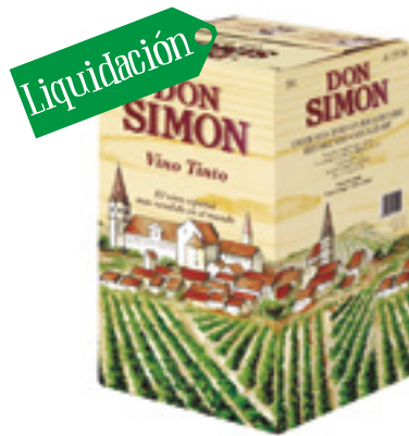
992030 · 20 l Vino Tinto Don Simón