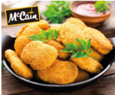
903426 · 5/1 Kg Nuggets de Pollo

Por la compra de una caja de Aros de Cebolla Cerveza o Spicy McCain ¡¡Regalo 1 bote Salsa Cheddar!!