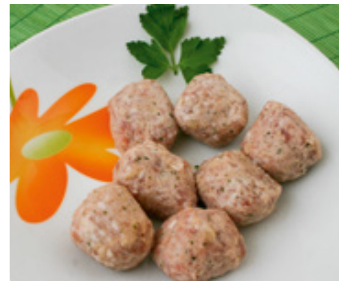
905051 · 100 x 30 g Albóndiga Ajo y Perejil