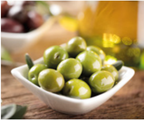
992019 · 2,2 kg Aceituna de Sosa