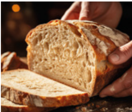
690307 · 5 bl/1,5 Kg Pan Rebanadas 23 x 38