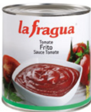
992003 · 6/3 kg Tomate Frito