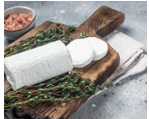
905934 · 12 x 180 g Mini Rulo Queso Cabra Madurado