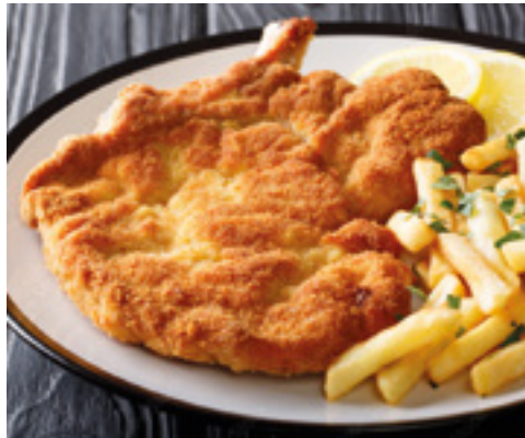
905109 · 3,5 Kg Milanesa de Pollo