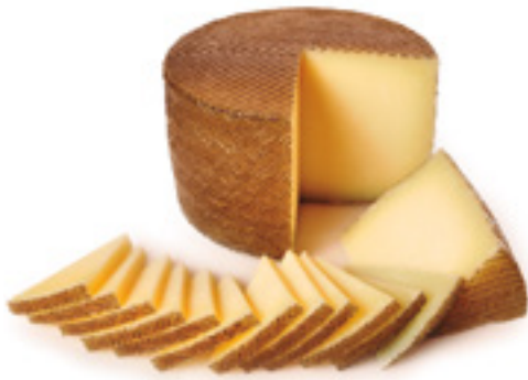
905914 · PV Queso Semicurado