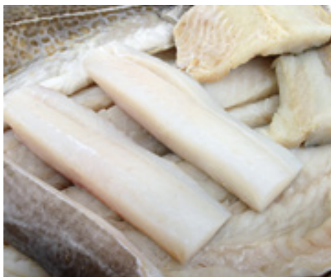
901040 · 6 kg 300 g Lomo Bacalao Selecto