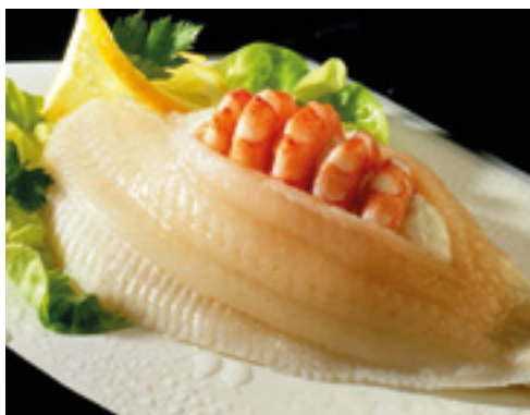
902003 · 3 Kg · 19 pz Filete Solla con Gambas