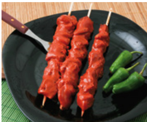
905033 · 25 ud Banderillas de Cerdo