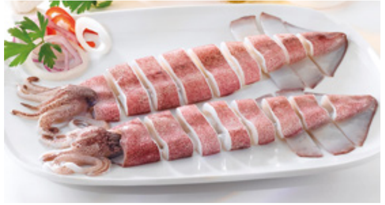
902095 · 6 x 1 Calamar Troceado