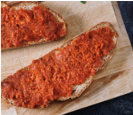
905904 · 2 st/1,5 Kg Sobrasada Tarrina