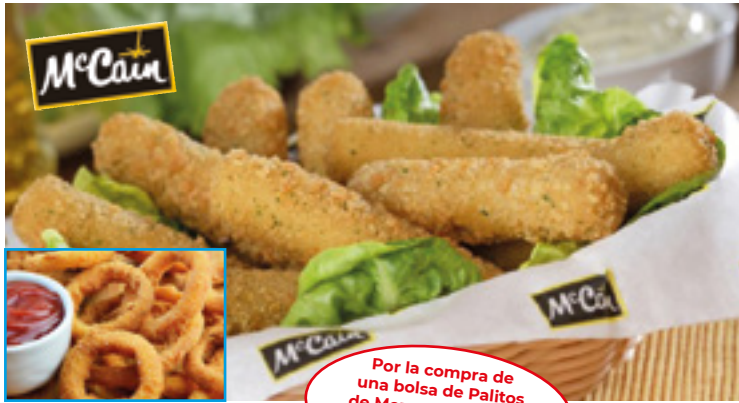
903427 · 6/1 Kg Palitos Mozzarella

Por la compra de una bolsa de Palitos de Mozzarella McCain ¡¡Regalo 1 bolsa Aros de Cebolla!!