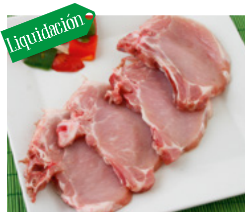
905048 · 5 Kg Chuleta de Lomo Cortada