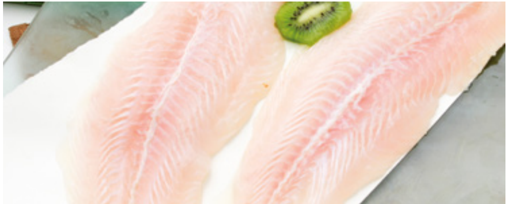
901961 · 6 x 1 kg · Bolsa 901960 · 5 kg · Interfoliado Filete de Panga 170/220