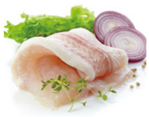
902078 · 2 Kg · 80/120 g Filete Lengua limpio