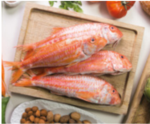
902026 · 5 Kg · 100/150 Salmonete Entero