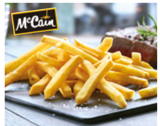
903402 · 5/2,5 Kg Patata 3/8 McCain