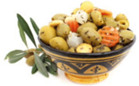
992018 · 7 kg Aceitunas Surtido