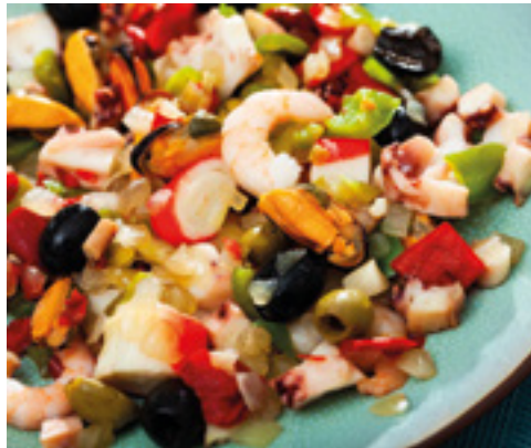
907006 · 4 kg Salpicón Cubo