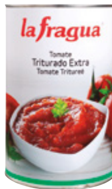
992001 · 3/5 Kg Tomate Triturado Natural