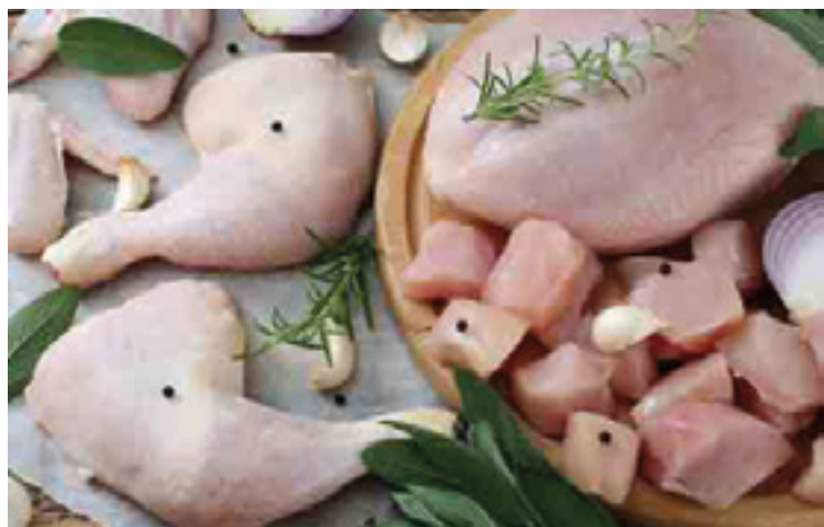
905004 · 5 Kg Muslo de Pollo