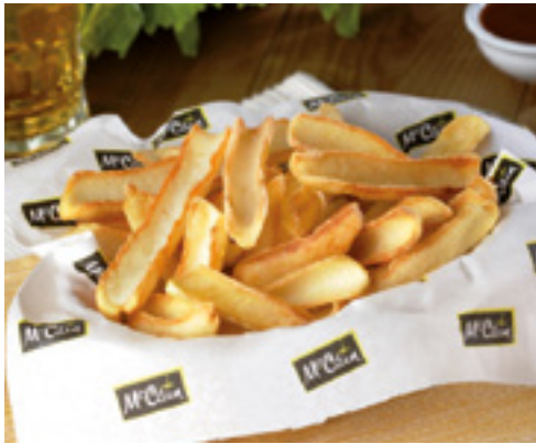
903415 · 5/2,5 Kg Patata Fry'n Dip