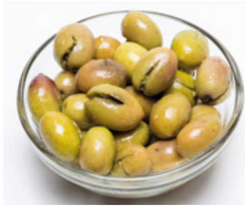
992015 · 2,2 kg Aceitunas Partidas