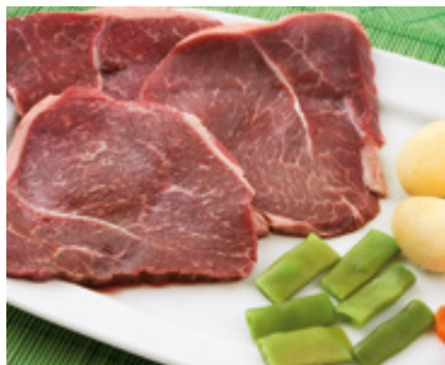
905036 · 1 c x 5 Kg Filete de Ternera 0,7 cm