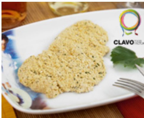
905013 · 4 Kg Pechuga Pollo Empanado