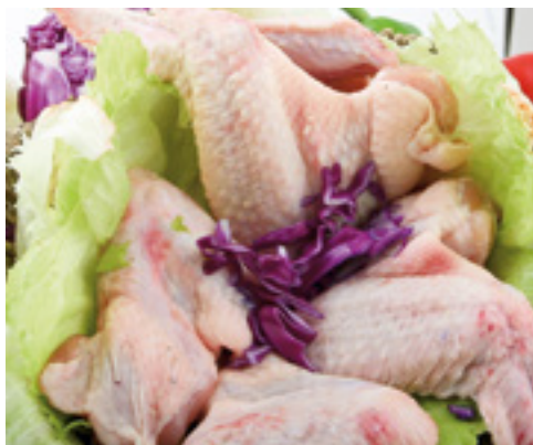
905090 · 4 Kg Alas de Pollo IQF