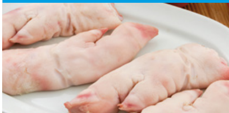
905097 · 4,5 Kg Cortados 1/2