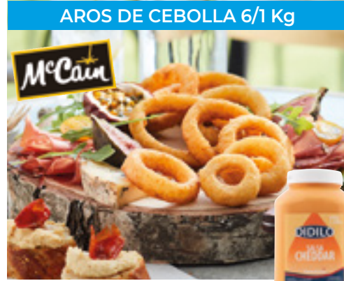
AROS DE CEBOLLA 6/1 Kg

Por la compra de una bolsa de Palitos de Mozzarella McCain ¡¡Regalo 1 bolsa Aros de Cebolla!!