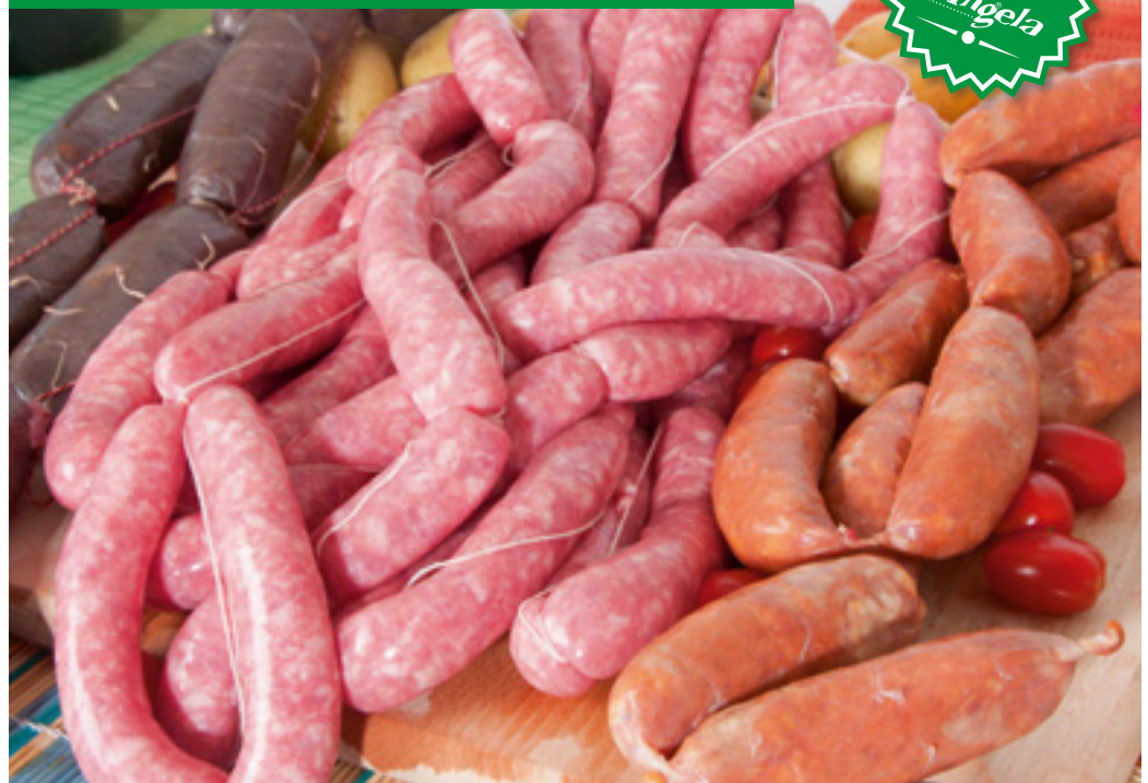
905946 · PV Morcilla