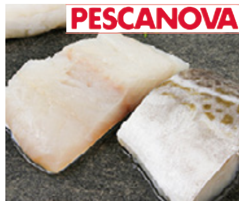
902089 · 4 kg Bacalao Supremas 220/290