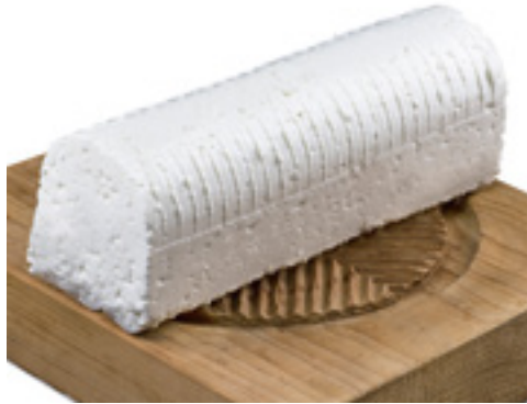
907102 · PV 1,5 kg aprox Queso Fresco