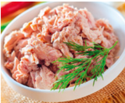
710001 · 1 kg Atún en Alimunio