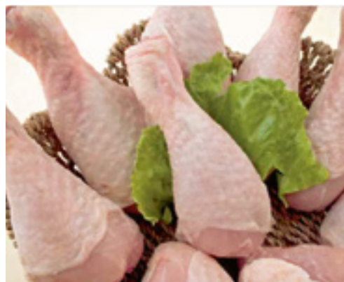
905016 · 5 bl/1Kg Jamoncito Pollo