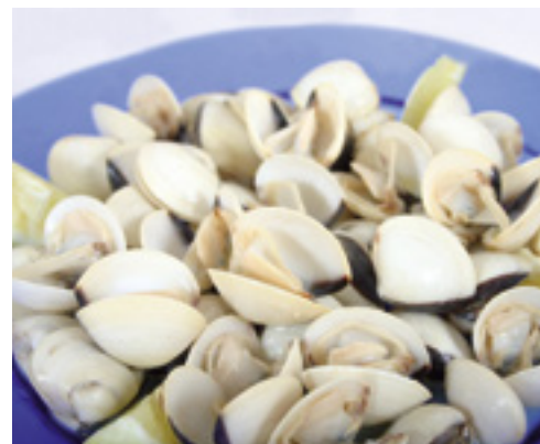
901965 · 6 x 1 Kg Almeja Blanca 60/80