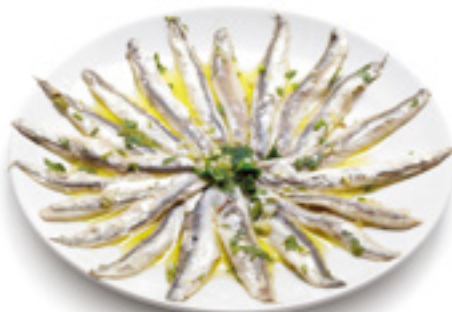
907001 · 700 g Boquerón al Ajillo