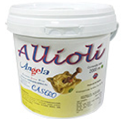
703020 · 2 l All i Oli Valenciano Ágl