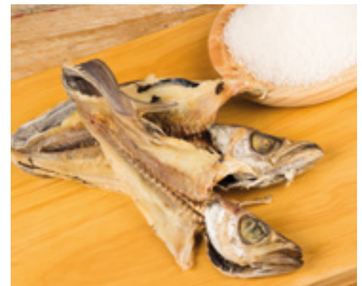
907201 · 2 kg Capellanes salados