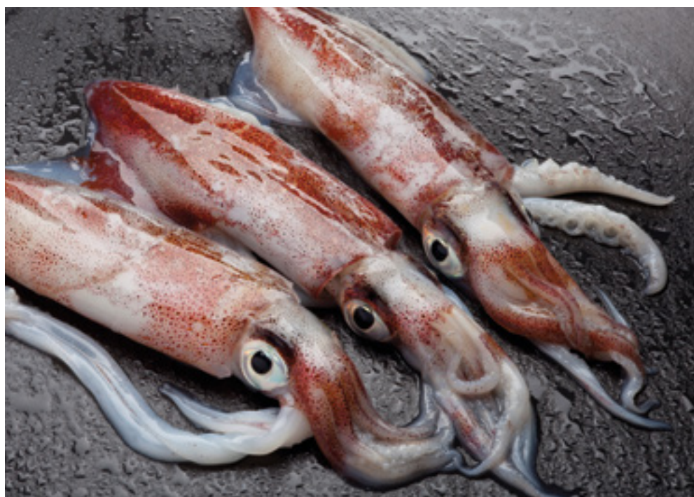
902104 Calamar Nacional 3P