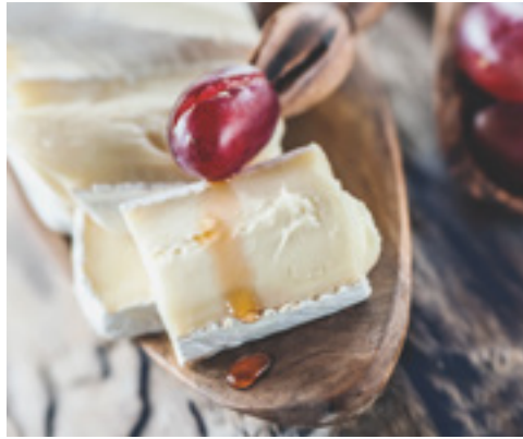
907103 · PV Queso Brie Vaca