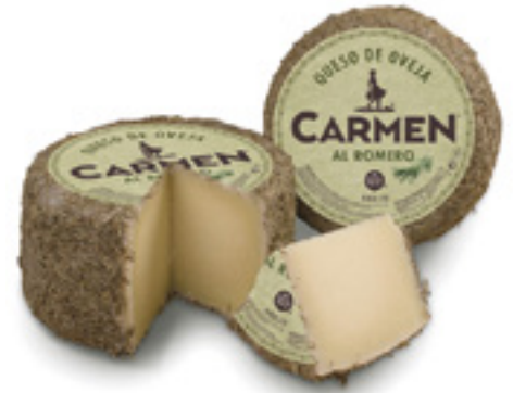
905927 · PV Queso de Oveja Romero