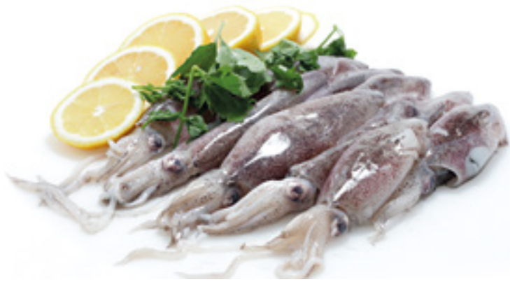
901023 · 6 x 1 Puntilla sin Pluma