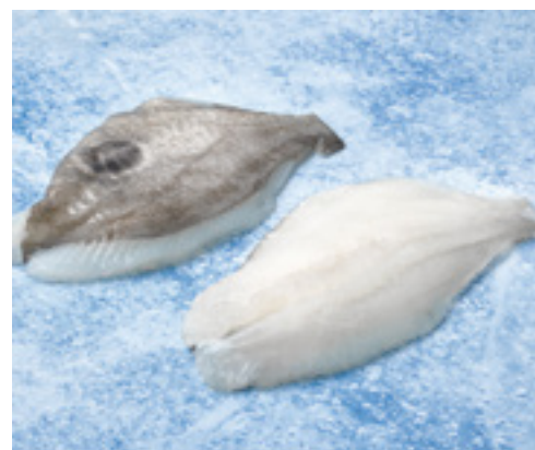
902076 · 5 kg Filete de Gallo 200/300