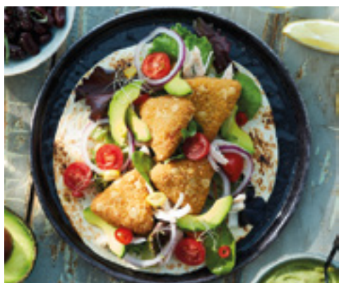
903436 · 6/1 Kg Nacho Cheese Triangles