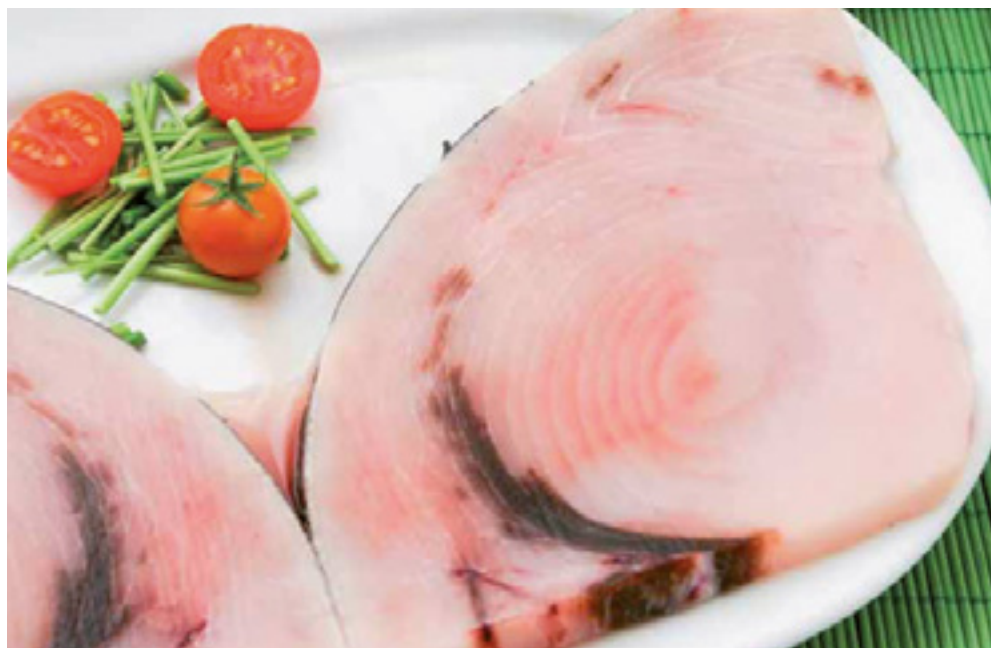
900604 - 900605 - 900606 · 5 kg Emperador Precortado Gama