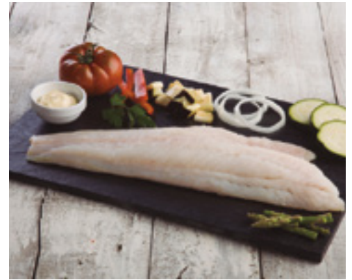
901008 · 11 Kg · 1000 + Filete Fogonero